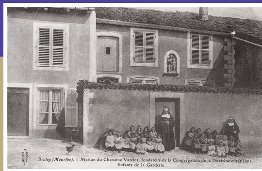
Carte postale de l'ancienne école de Bruley