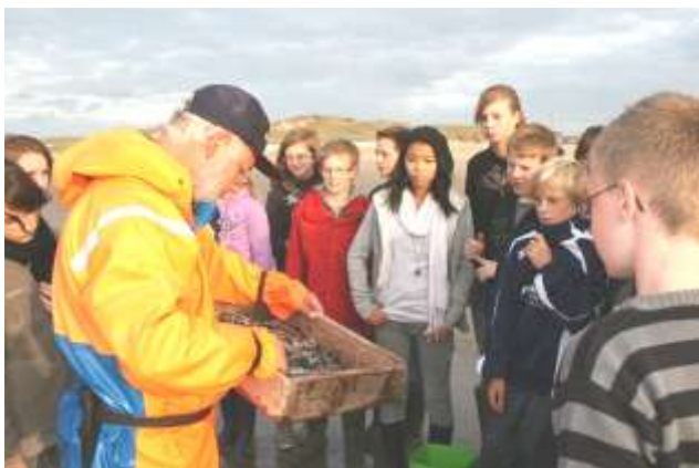
Classes de mer