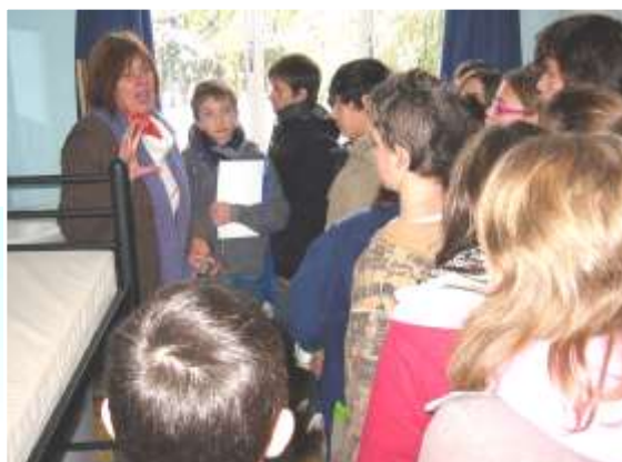
Visite à Fedasil